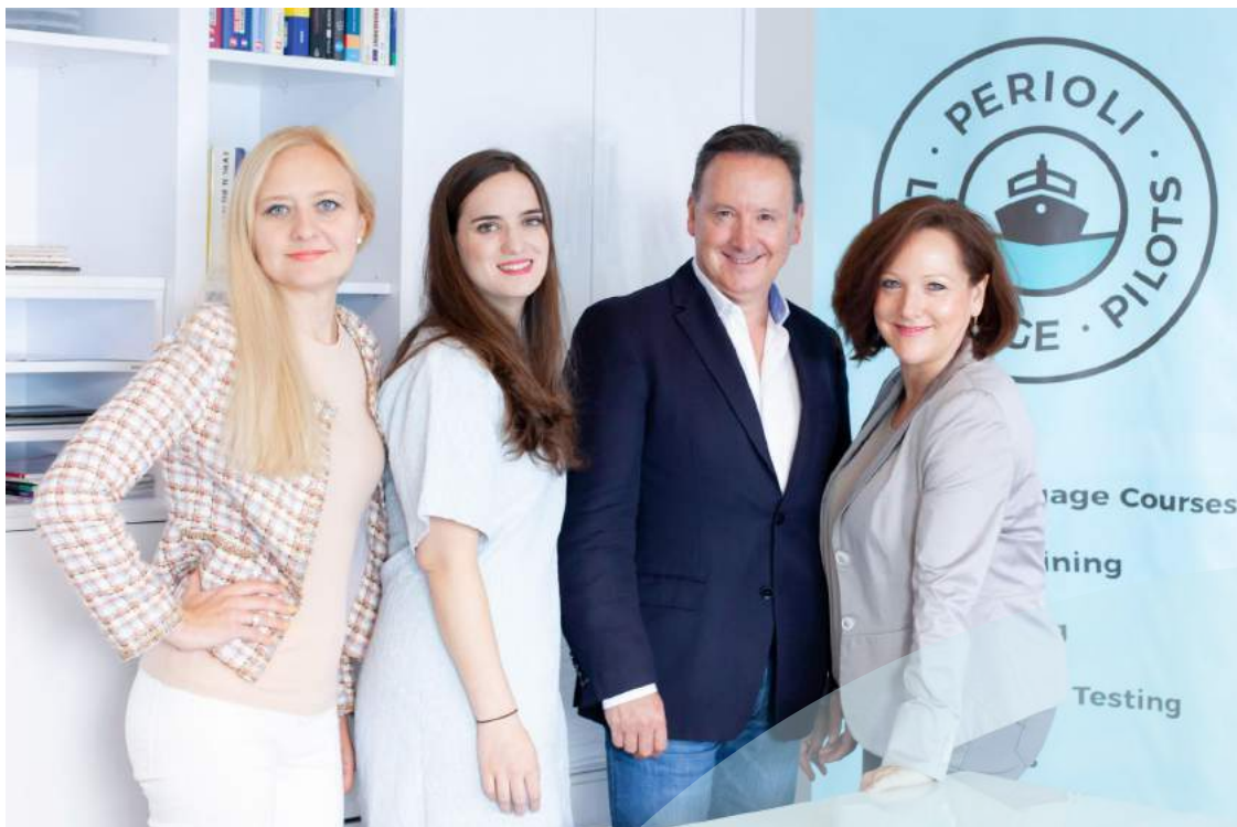
Periol Language Pilots Team