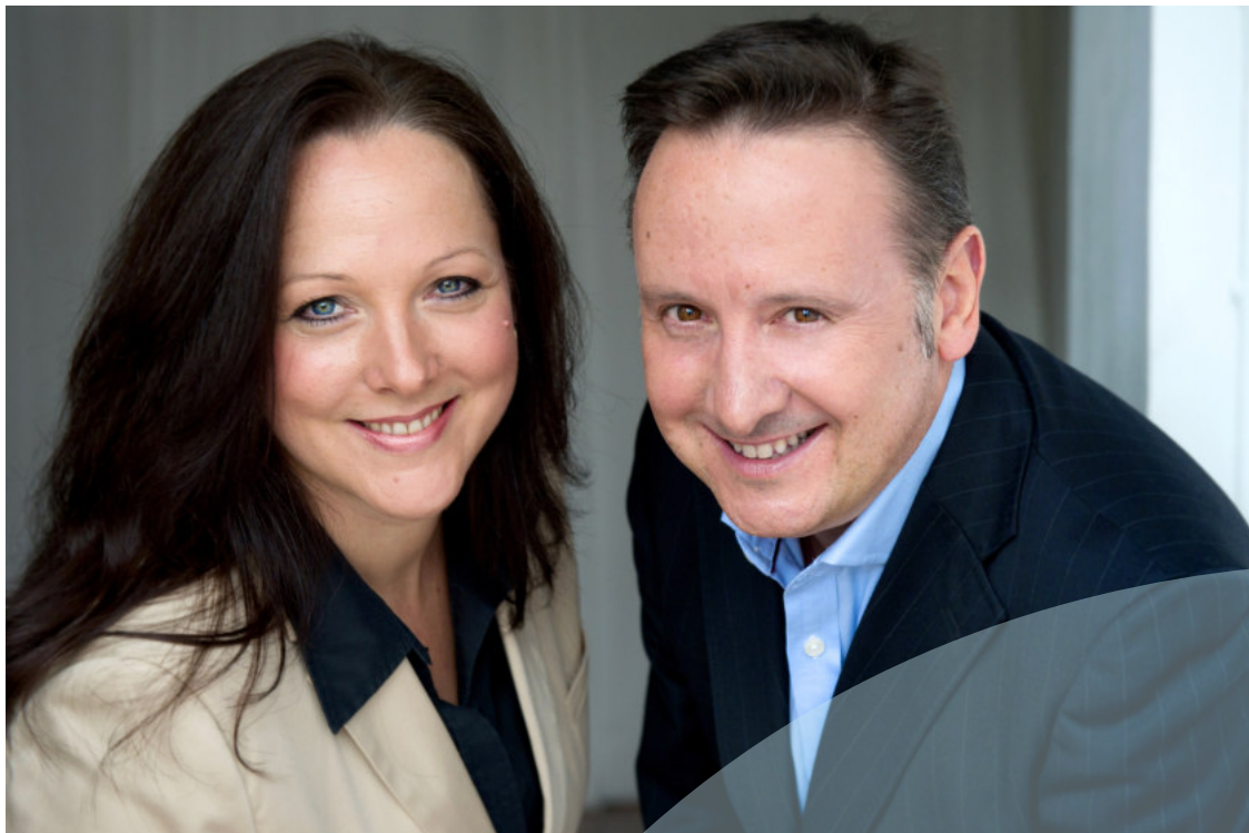
Inhaber und Geschäftsführer