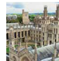
love2learn in Oxford