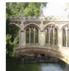
love2learn in Cambridge

So profitieren Sie vor Ort und täglich von kleinen und großen Erfolgserlebnissen. Ob im Einzelunterricht oder in einer Kleingruppe: Fühlen Sie sich wie zu Hause, z.B. in London, Oxford, Cambridge oder Boston.