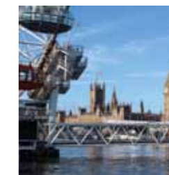
love2learn in London